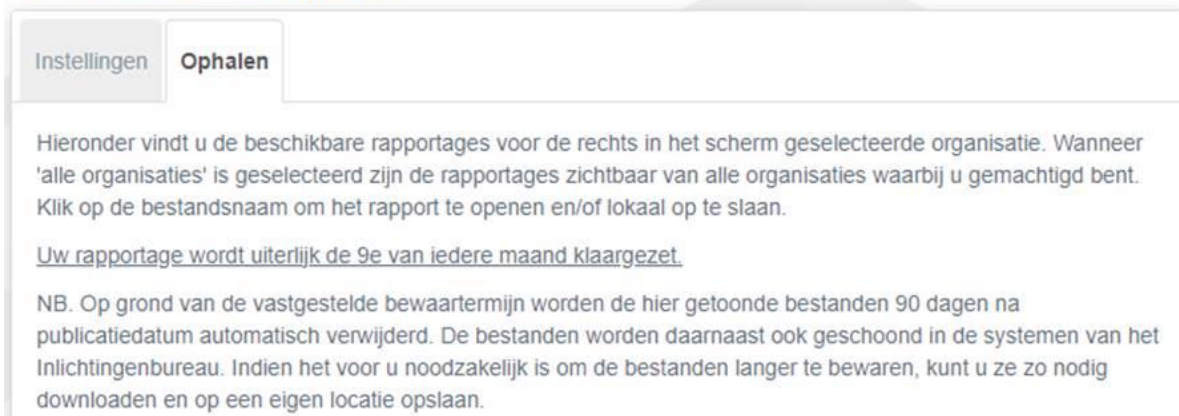
Afbeelding 3: Tabblad Ophalen

Op grond van de vastgestelde wettelijke bewaartermijn is een rapport 90 dagen op het portaal zichtbaar en zal vervolgens worden verwijderd. Indien u de rapporten langer wilt bewaren kunt u ze downloaden en lokaal opslaan.